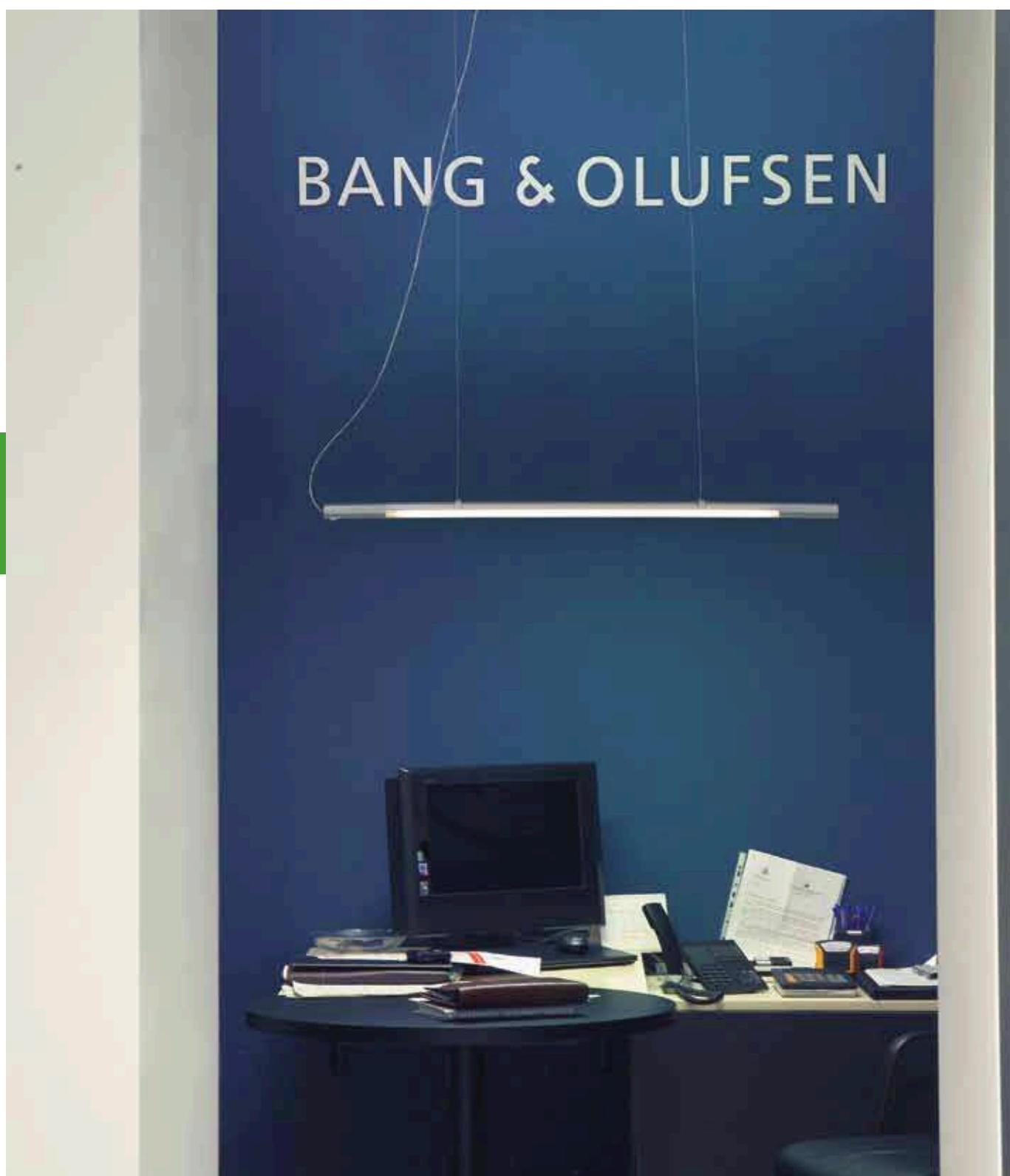
0533 Kit per sospensione 0533 Suspension kit